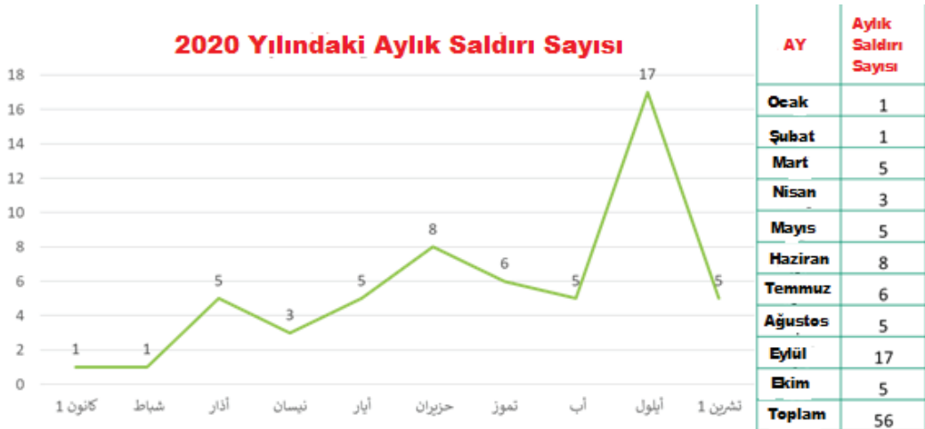
Şekil 2: Aylık saldırıların zaman çizelgesi

2. Olayların zaman çizelgesine bakıldığında, haziran ayından itibaren saldırı sayısında net bir artış olduğu